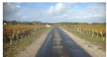
道を隔てて左がシャトー・マルゴー、 右がシャトー・デ・ゼラン