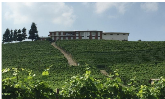
写真(左)：右から畑から醸造まで全てを取り仕切るマルコ氏。娘エマニュエラ女史。妻アンナ女史。 写真(右上)：左・アンナ女史、中央・セリオ氏、右・アンナの娘エマニュエラ女史。 写真(右下)：カンヌビの丘の下から見たカンティーナ。