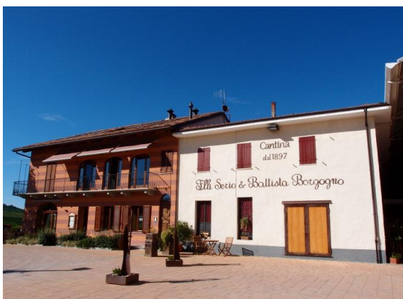
カンティーナ入り口