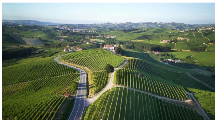
カンヌビの丘の頂上にあるカンティーナ